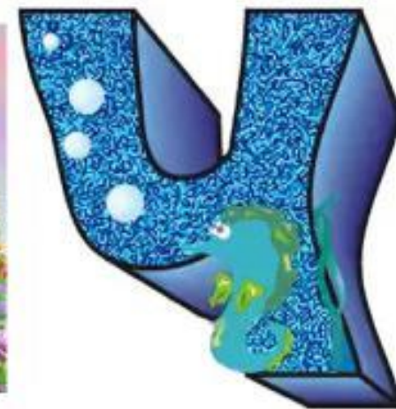
С праздником- Любимый город!