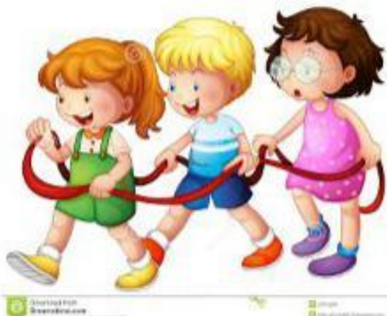
С праздником- дети!