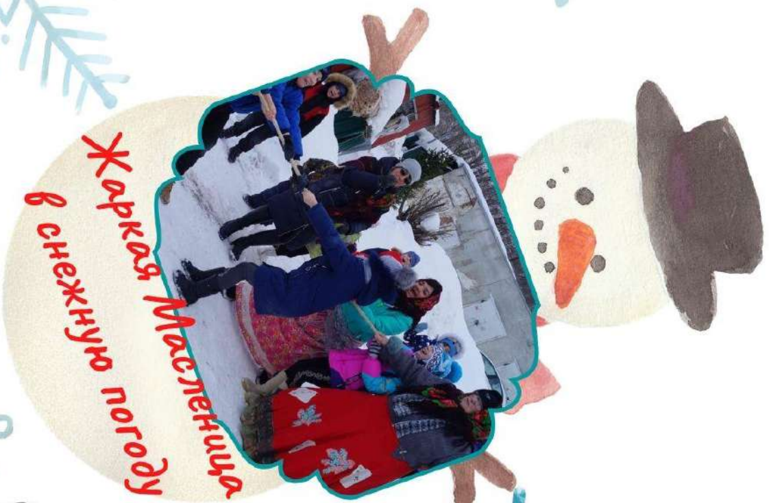
Жаркая Масленица в снежную погоду