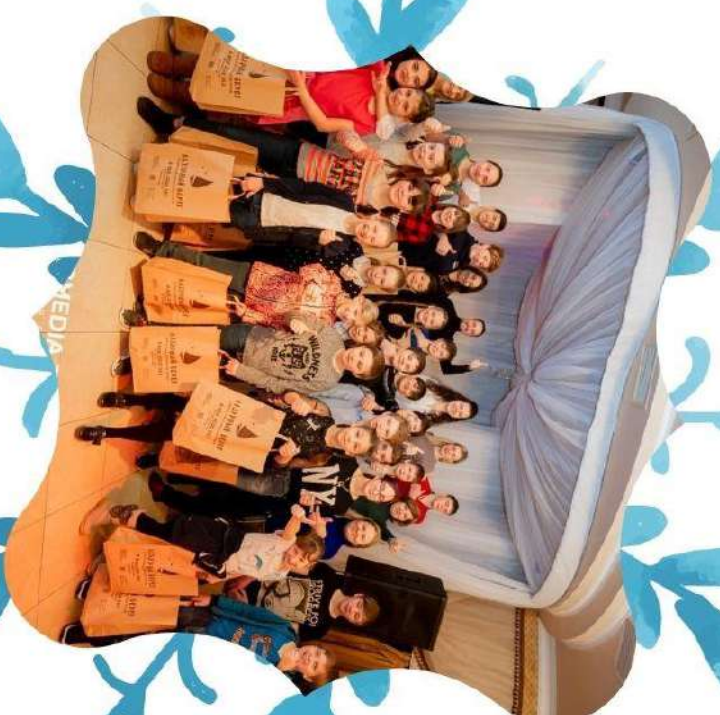
Веселая экскурсия и невероятно вкусное угощение в ресторане "Лазурный берег"