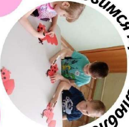
Готовимся к Дню любимых вещей